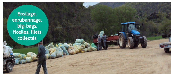
Ensilage, enrubannage, big-bags, ficelles, filets collectés