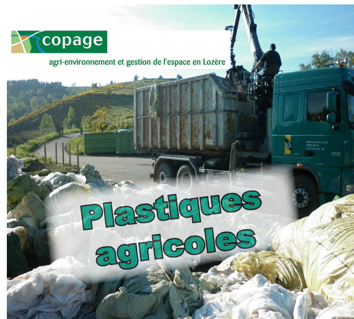
Collecte annuelle organisée par le COPAGE dans le cadre de la filière nationale ADIVALOR